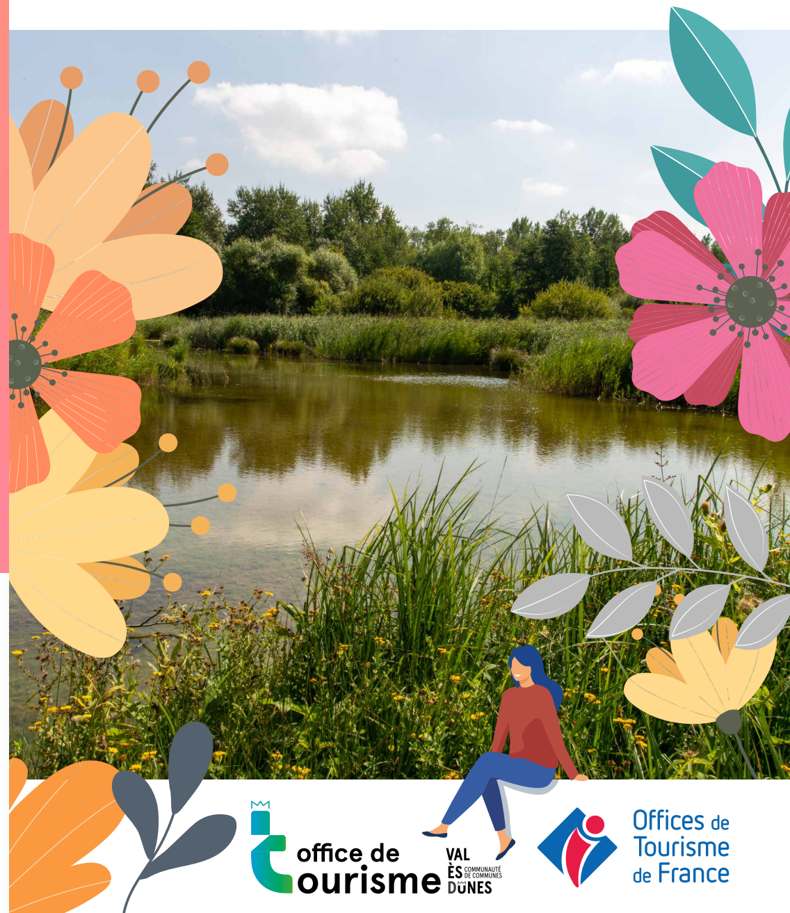
Publication : CDC Val ès dunes - Imprimé avec des encres végétales sur papier recyclé par Kik Studio